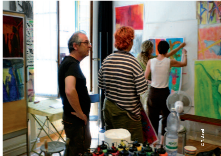
L'expérience de l'atelier de peinture conduit à un élargissement de la vie affective, sociale et culturelle.

Le participant a dit avoir profondément et presque physiquement expérimenté la force de l'animal et avoir découvert en lui des ressources vitales inattendues. Réactiver le monde des émotions est très important pour des personnes qui, dans des périodes difficiles de maladie ou de "non-vie", ont perdu