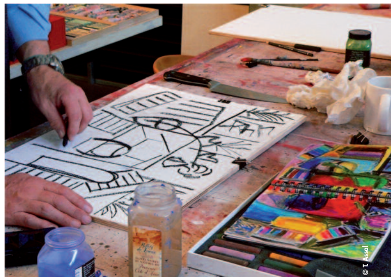
L'épreuve de l'effort traversé pour aboutir à un résultat pictural renforce l'estime de soi.

Chaque atelier dure deux jours et demi consécutifs et a lieu en moyenne une fois par mois. Les participants sont des adultes. Les groupes, constitués de 8 à 10 participants, sont hétérogènes : les différences sont liées à l'âge, à la profession, à l'état de santé, à la motivation à s'inscrire, à la culture et au